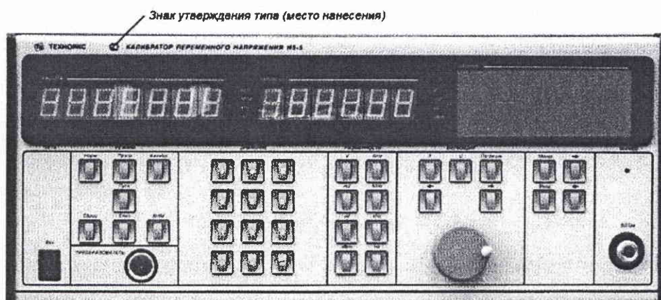
Рисунок 1 - Внешний вид калибратора (вид спереди)

По условиям эксплуатации калибраторы удовлетворяют требованиям группы 1.1 по ГОСТ РВ 20.39.304-98 климатического исполнения УХЛ с диапазоном рабочих температур от 5 до 40 °С и относительной влажностью окружающего воздуха до 90 % при температуре 30 °С.